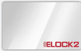
SLS-93 (Standard Design)